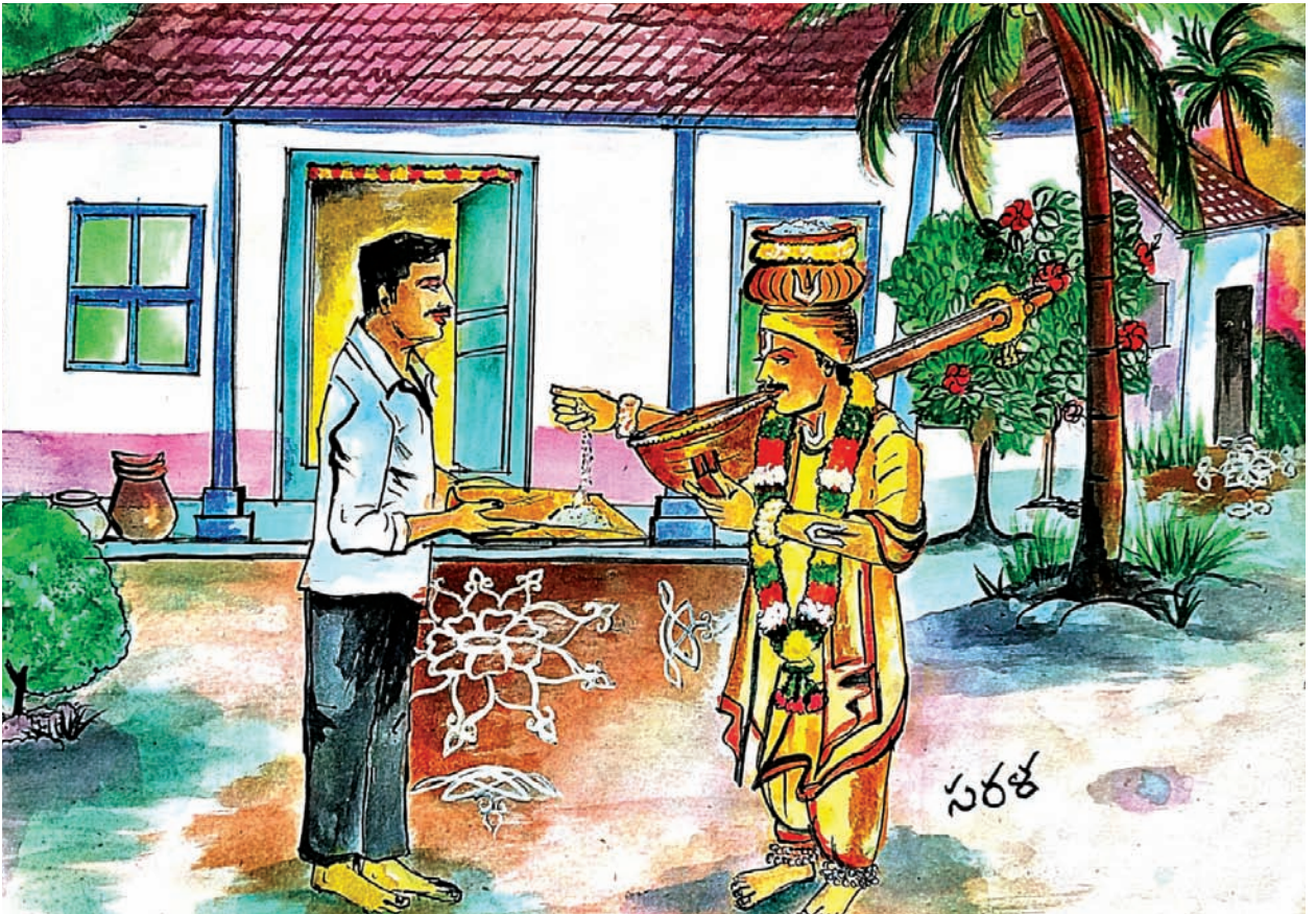
శ్రీ వేంకటేశ్వర కృపాకటాక్ష సిద్ధిరస్తు అని దీవిస్తున్న హరిదాసు

తేది 29-01-2022 కల : ఈ కలలో నేను మా ఊరిలోని పాత ఇంటిలో ఉన్నాను. అదే మా ఇల్లంట. భిక్షాటనకై ఒక హరిదాసు వచ్చాడు. వాకిట్లో నిలబడి, ఇంటిలో ఉన్న మమ్మల్ని భిక్షం వేయండి అనే విధంగా తన సహజ ప్రవర్తనైన “హరిలో రంగ హరి” అంటూ చిరుతలు వాయిస్తూ నిలుచున్నాడు. నేను ఒక చాటలో బియ్యం తీసుకుని గడప దాటి ఆ హరిదాసు అక్షయపాత్రలో పోశాను. దానికి ప్రతిగా తన అక్షయ పాత్ర నుండి కొన్ని బియ్యాన్ని తన పిడికిలితో తీసి, నేను తెచ్చిన చాటలో ప్రతిఫలంగా మూడుసార్లు పోశాడు. “శ్రీవేంకటేశ్వర కృపా కటాక్ష సిద్ధిరస్తు” అని దీవిస్తూ ఈ బియ్యాన్ని ప్రతిఫలంగా పోశాడు. వెంటనే అతడన్న “శ్రీవేంకటేశ్వర కృపా కటాక్ష సిద్ధిరస్తు” అనే మాట నా హృదయంలో ప్రతిధ్వనించసాగింది. ఉదయం 5.30 కు అలారం మ్రోగడంతో కల చెదిరింది. కాని శ్రీవేంకటేశ్వర కృపా కటాక్ష సిద్ధిరస్తు అనే మాట మాటి మాటికీ వినపడుచున్నది.